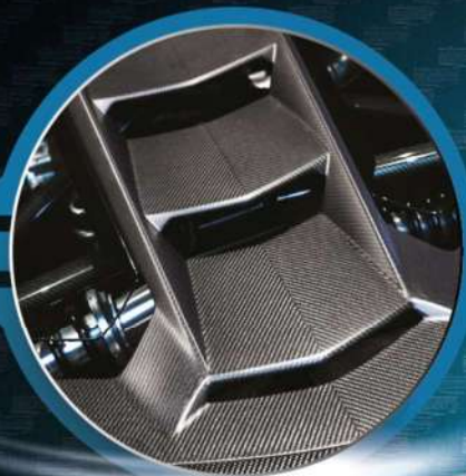
SPECIAL CARS E AUTO ELETTRICHE

Nuovi sistemi di stampaggio consentono di estendere l'utilizzo della fibra di carbonio su più larga scala