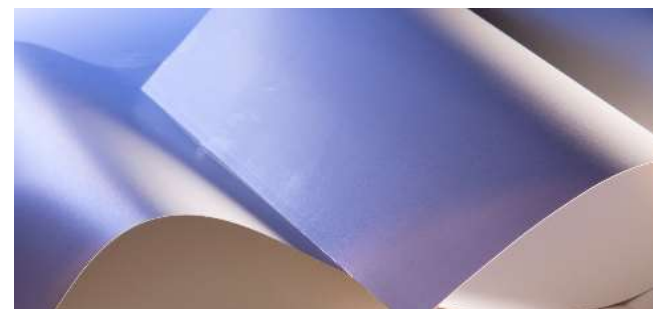
Specialty Coatings and Materials