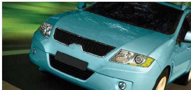
Automotive OEM Coatings