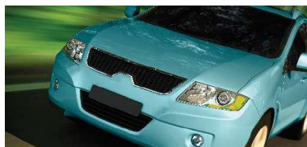
Automotive OEM Coatings