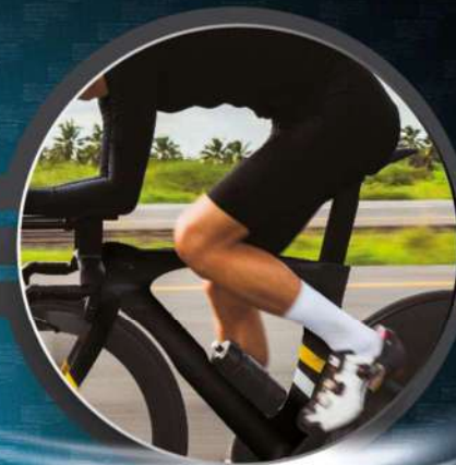
ARTICOLI SPORTIVI E ACCESSORI